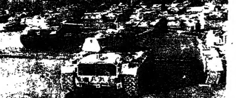
الديابات الامريكية الصنع التي غنمتها القوات العراقية في حربها مع ايران

وعلم مراسلنا انه وزعت من قبل اللجنة مبلغ مماثلة وتقس الامدادات والفتيات للقرى العربية في المثلث .